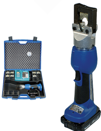
Art. EK354L/Miete pro Woche *89. 50 (M)