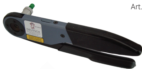
Art. HDT48/Miete pro Woche *24. 50 (M)

Die passenden Presseinsätze liegen bei und die Rücksendung erfolgt mit beigelegter Rücksende-Etikette.