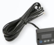
Art. LCDHPSW 39. 90 (D)