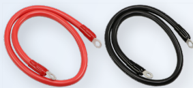
Batteriekabel (Modelle 2'000 und 3'000 W)