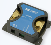
Art. CSHPSW 169. 00 (D)