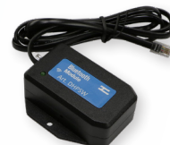
Art. DHPSW 39. 90 (D)