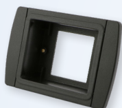
Art. FHPSW 19. 00 (D)