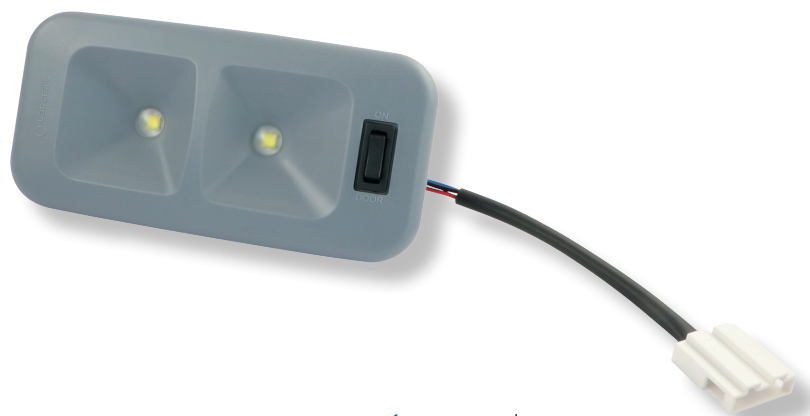
Art. V60 135 x 60 x 25 mm 149.00 (B)