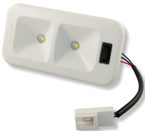
Art. V40 135 x 70 x 36 mm 149.00 (B)