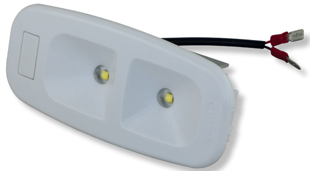
Art. V31 137 x 60 x 32 mm 149.00 (B)