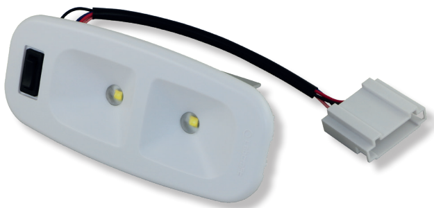
Art. V30 137 x 60 x 32 mm 149.00 (B)