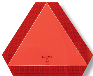
Art. 134102 Metalltafel* 29. 80 (A)