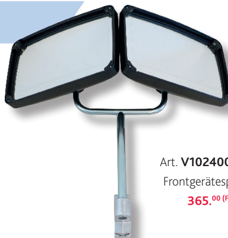
Art. V102400/VTS Frontgerätespiegel 365. 00 (F)