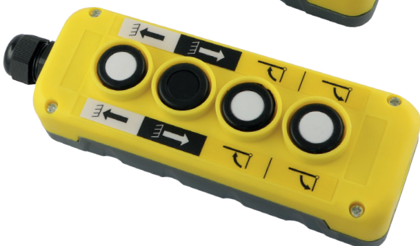
Art. SK4PG Schaltkasten mit 4 Knöpfen: heben - senken - öffnen - schliessen 172 x 60 x 55 mm 128. 00 (B)