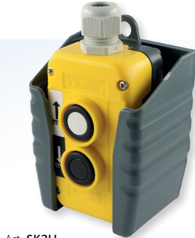
Art. SK2H 17.50 (B)