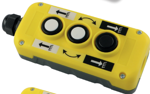
Art. SK3PG Schaltkasten mit 3 Knöpfen: heben - senken - öffnen 141 x 60 x 55 mm 76. 00 (B)