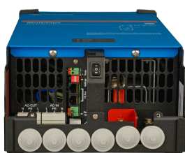
MultiPlus 2000 VA (untere Abdeckung)