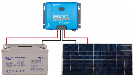
Figure 1: Power connections Illustration 1 : Connexions électriques Abbildung 1: Stromanschlüsse Figura 1: Conexiones de alimentación Bild 1: Strömanslutningar