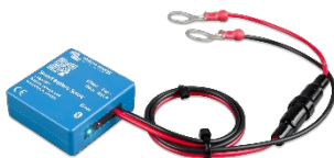
Bluetooth-Erkennung: Smart Battery Sense