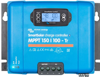
SmartSolar-Lade-Regler MPPT 150/100-Tr mit optionalem einsteckbarem Display