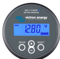
Bluetooth-Erkennung: BMV-712 Smart Battery Monitor