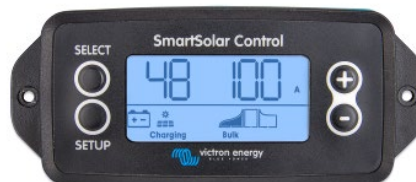
Einsteckbares SmartSolar display