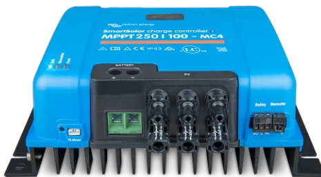
SmartSolar-Lade-Regler MPPT 150/100-MC4 ohne Display

Entfernen Sie einfach die Gummidichtung, die den Stecker an der Vorderseite des Reglers schützt und stecken Sie das Display ein.