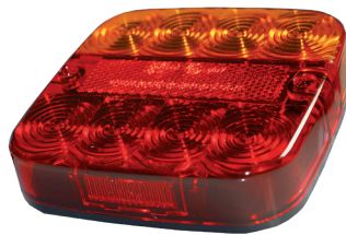
Art. 99AR 43. 00 (A)