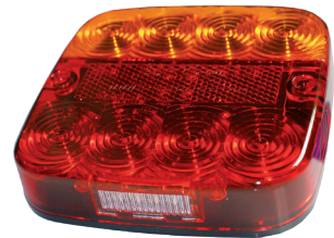
Art. 99ARL inkl. Kennzeichenleuchte 44. 00 (A)