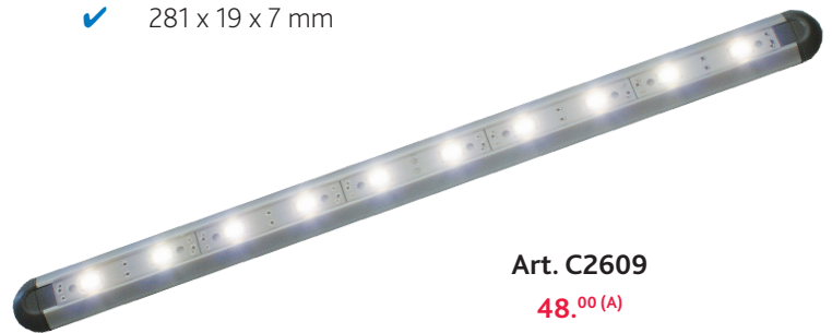
Art. C2609 48. 00 (A)