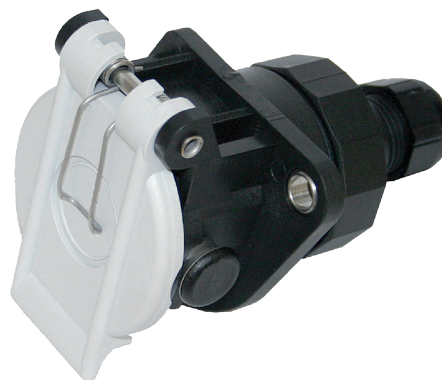
Art. AK646/1 AK Ladesteckdose 113. 40 (A)