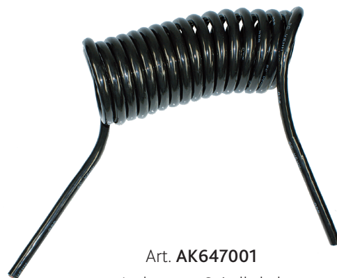
Art. AK647001 Ladestrom-Spiralkabel 291. 00 (A)