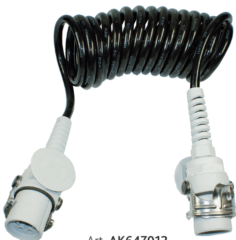
Art. AK647012 Ladestrom-Spiralkabel mit innenliegender Zugentlastung 529. 10 (B)