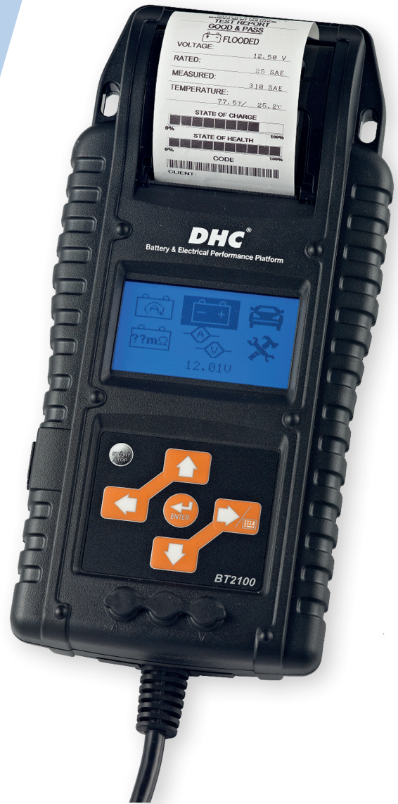
Art. BT2100 380. 00 (0)