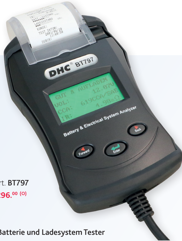
Art. BT797 296. 00 (0)