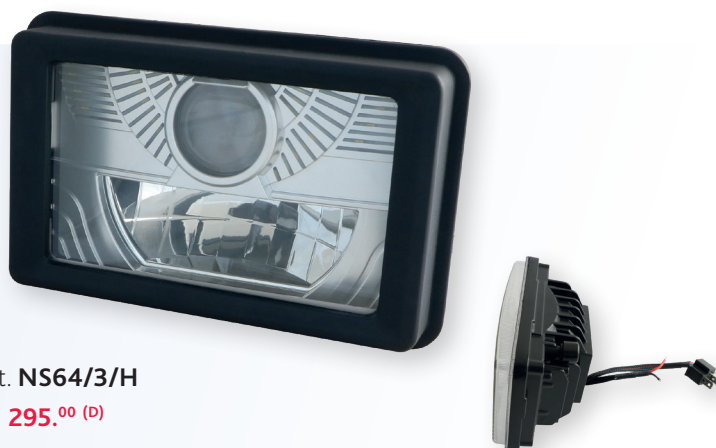
Art. NS64/3/H 295.00 (D)