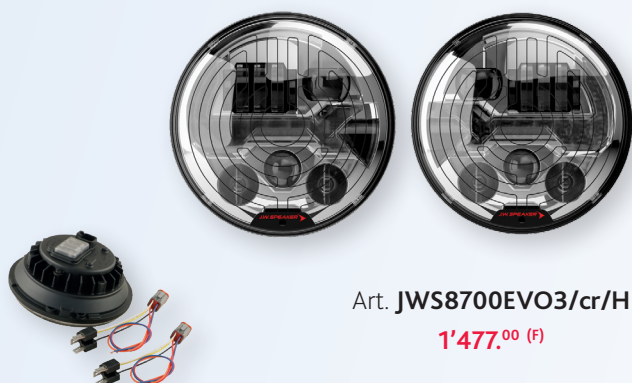
Art. JWS8700EVO3/cr/H 1'477.00 (F)