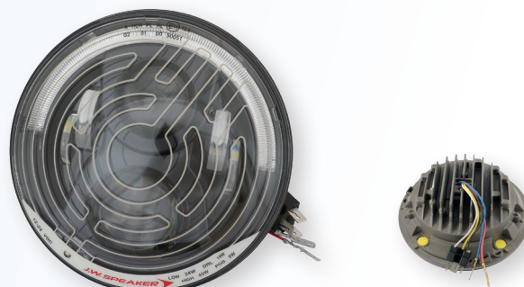
Art. JWS8700EVO2/sz/H 659.00 (F)