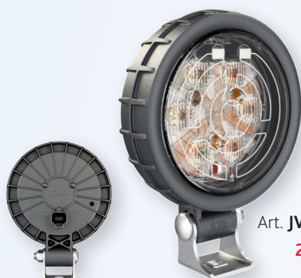
Art. JWS670XD/or 239.00 (D)